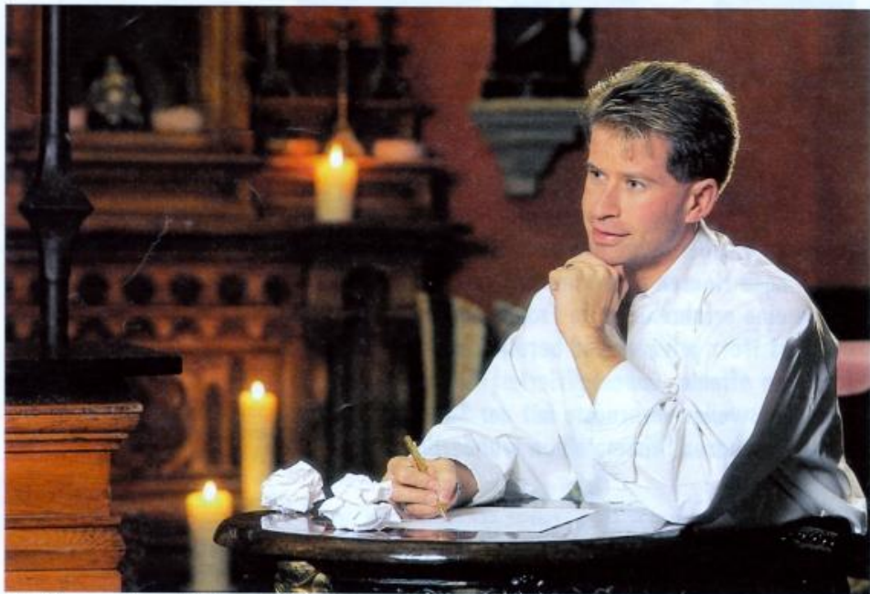
Die Schlager von Leonard sind von Gefühl und Liebe geprägt. Liebesbriefe schreibt der Romantiker allerdings selten.

Liebe heisst auch einsam sein, heisst auch manchmal warten. Liebe heisst, dann treu zu sein, Spiel mit offenen Karten. Liebe heisst Gemeinsamkeit, den selben Weg zu geh'n. Für einander da zu sein, aber doch auf eigenen Beinen steh'n.