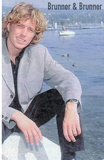
Brunner &amp; Brunner