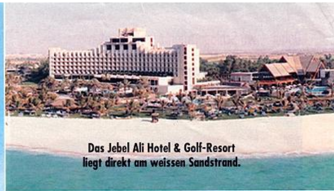
Das Jebel Ali Hotel & Golf-Resort liegt direkt am weissen Sandstrand.

stehen im interessanten Gegensatz zu moderner Architektur – ist vor allem als Einkaufsparadies mit niedrigen Preisen bekannt. Als Höhepunkt erleben die Schlagerfans ein einzigartiges Konzert mit den meisten der Künstler mitten in der Wüste. Die Schlagerparty wird umrahmt von einem Barbecue mit Bauchtänzerinnen und vielen Überraschungen! Noch nie zuvor hat die Regierung die Bewilligung für ein derartiges Show-Spektakel gegeben. Na-