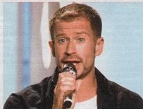
2001: „Rhythmus der Nacht“, „Einmal im Leben“ sind die Hits dieses Jahres. „Schon als Kind habe ich mit Begeisterung deutsche Schlager gehört“, erzählt der Schlagerstar und Inhaber eines Designer-Möbelgeschäftes