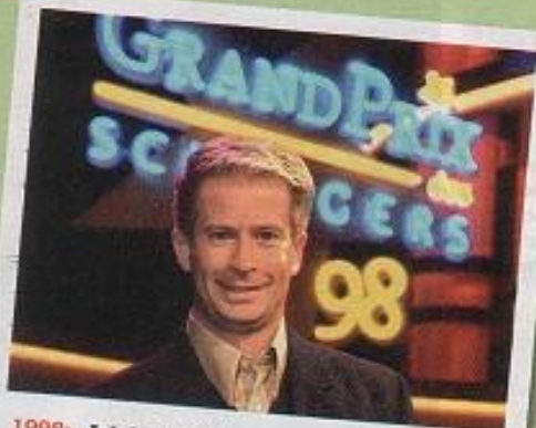
1998: „Ich bin da“ singt der Star beim „Grand Prix des Schlagers“ und belegt Platz 7. Im MDR moderiert er die Show „Leonard: Träume sind immer dabei“, in der er seine Heimat rund um den Vierwaldstätter See vorstellt