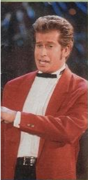
1996: Nach „Davon träume ich“ (1994) und „Doreen“ (1995) singt Leonard jetzt „Ein kleines Lied“ und veröffentlicht das Album „Jetzt oder nie“