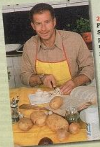
2002: Nur für das Foto spielt der Sänger den perfekten Hausmann. „Ich putze nicht sehr gerne“, gesteht er. Und wenn er jemanden zum Essen einlädt, wird nie alles zusammen fertig. In diesem Zusammenhang hat er einen musikalischen Tipp: „Hauptsache Du liebst“