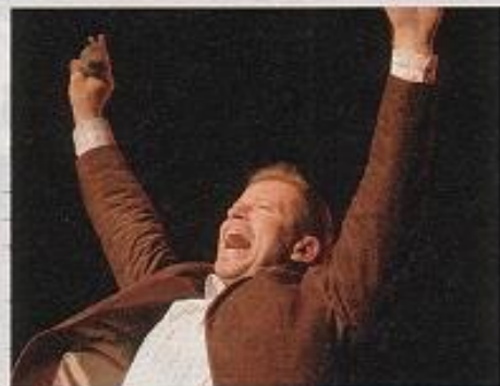
2005: Leonard feiert sein 20-jähriges Bühnenjubiläum mit dem Album „Wunderbare Jahre“. Nach „Hit auf Hit an der Adria“ (2004) wandert er mit „Hit auf Hit - in den Schweizer Alpen“ und moderiert nun diverse Veranstaltungen