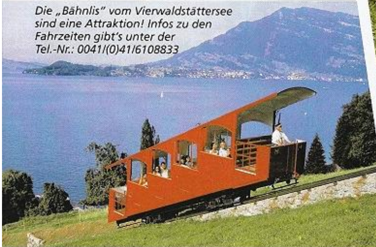
Die „Bähnli“ vom Vierwaldstättersee sind eine Attraktion! Infos zu den Fahrzeiten gibt's unter der Tel.-Nr.: 0041(0)4116108833