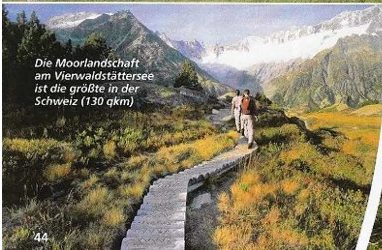
Die Moorlandschaft am Vierwaldstättersee ist die größte in der Schweiz (130 qkm)