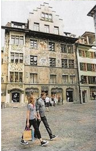
◀ Ein Bummel durch Luzern (hier: der Hirschenplatz) macht Jung und Alt Spaß!