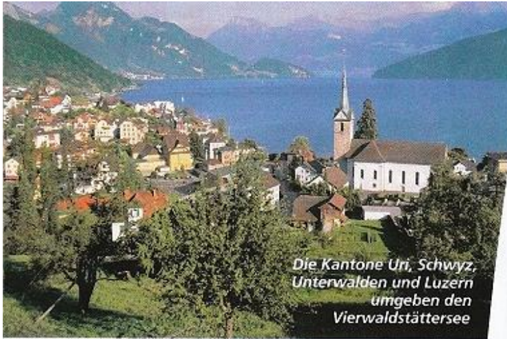
Die Kantone Uri, Schwyz, Unterwalden und Luzern umgeben den Vierwaldstättersee